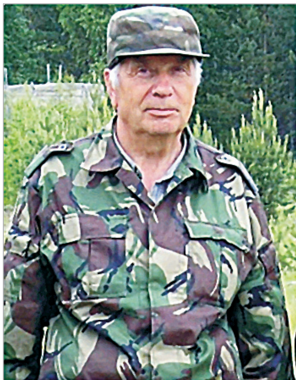
Рис. 5. Решение лесопожарной проблемы в Прибайкалье – неперемное условие чистоты воды в озере. Таков лейтмотив всей творческой жизни автора.

берегов озера на посещаемых горе-туристами участках не выдерживает элементарной критики даже в пожарном отношении. Скопления брошенного хлама изобилуют легковоспламеняющимися материалами (пластик, пр.), которые в отличие от обычного лесного опада, способны гореть при любой погоде (рис. 5).